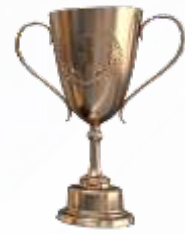
TRHOPY JUARA III