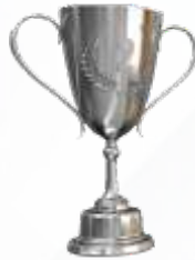
TRHOPY JUARA II