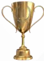
TRHOPY JUARA I

Perhitungan juara umum diambil dari akumulasi perolehan medali Emas.